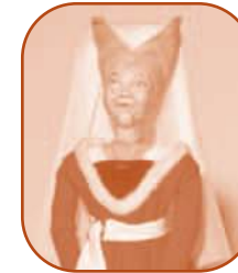
Isabeau, dame du XV e siècle.