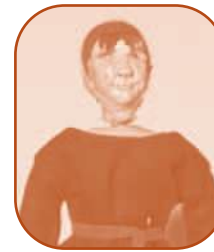
Jehan, paysan du XII e siècle.