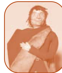
Thibault, seigneur du XII e siècle.