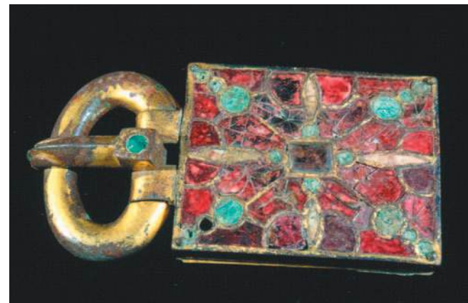
Boucle de ceinture de type wisigothique (alliage cuivreux doré, malachite et verroteries blanches et rouges) du VI e siècle, découverte lors de la fouille de la nécropole mérovingienne de Vicq.