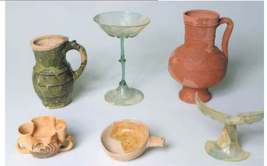
Vaisselle de table du XIII e au XV e siècle, découverte à Poissy et au château de la Madeleine à Chevreuse.