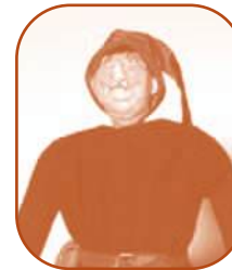
Guillaume, marchand du XV e siècle.