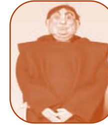
Frère Benoît, moine bénédictin (à partir du XIII e siècle).