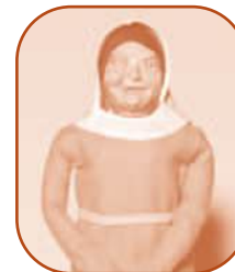
Margot, paysanne du XII e siècle.