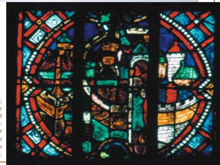
Vitrail du XIII e siècle, église Sainte-Anne de Gassicourt à Mantes-la-Jolie. La ville, symbolisée par sa muraille, marque son identité vis-à-vis de la campagne environnante.