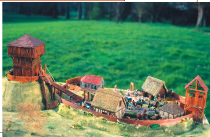
Un château à motte aux XI e -XII e siècles (maquette au 1/70 e ).

L'équipe de Seine et Yvelines Archéologie