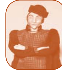
Robert, seigneur du XV e siècle.