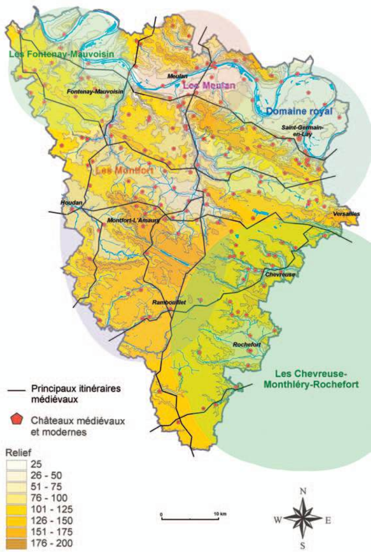
Carte des zones d'influence des principales familles seigneuriales avec la localisation des châteaux et des voies médiévales attestés.

Corrigé du cahier-enquête de l'exposition « Petit tour au Moyen Âge »